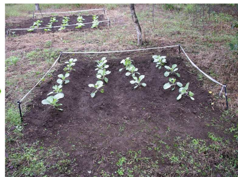
種まき・苗の植付ができます