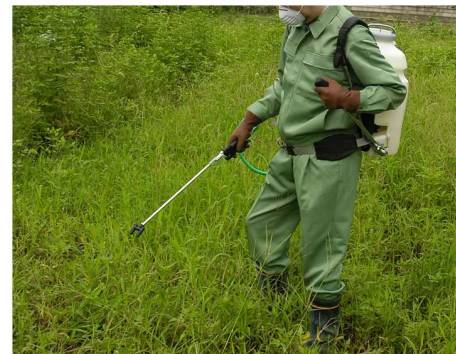
噴霧器やジョーロで散布します